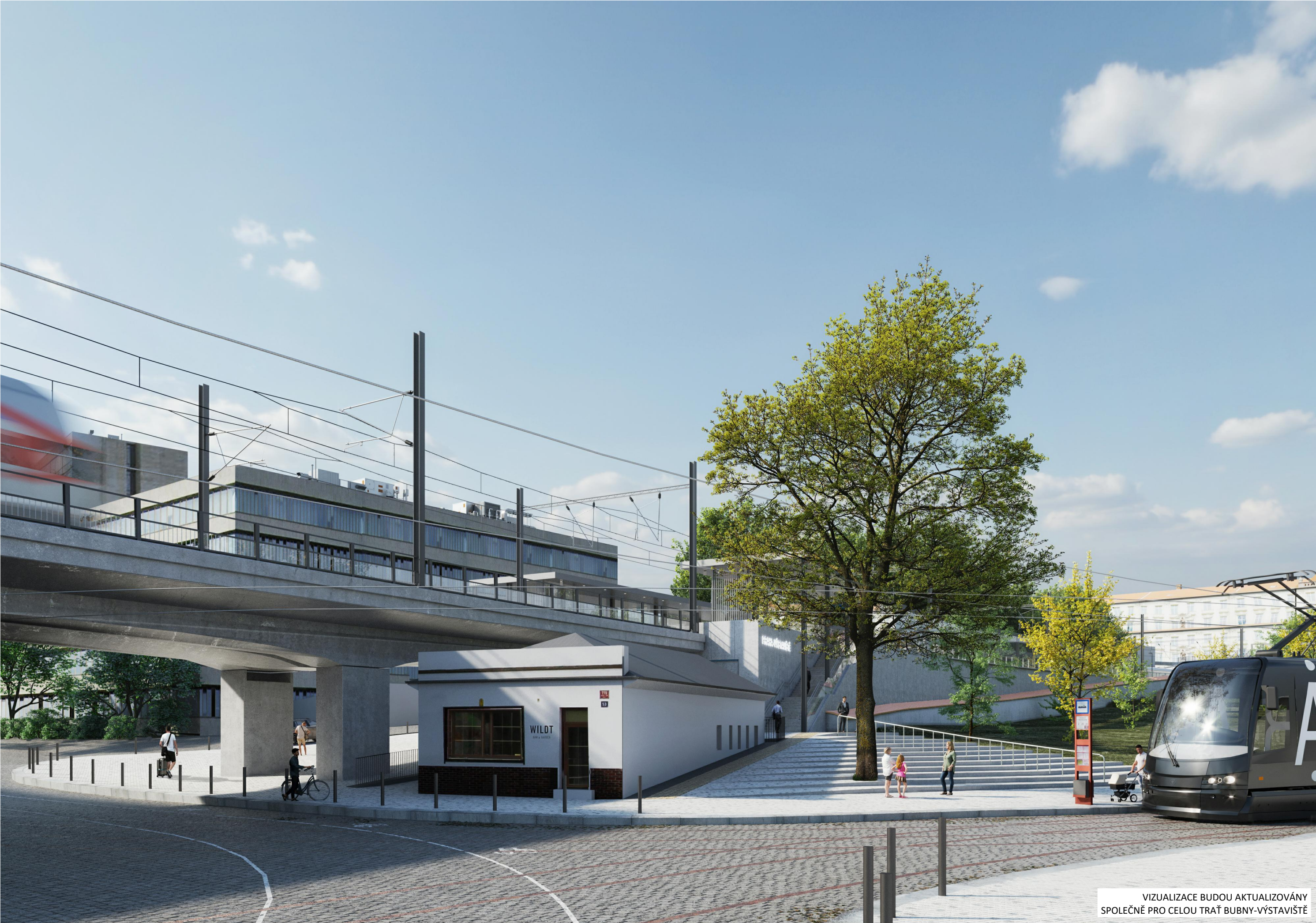
VIZUALIZACE BUDOU AKTUALIZOVÁNY SPOLEČNĚ PRO CELOU TRÁŤ BUBNY-VÝSTAVIŠTĚ